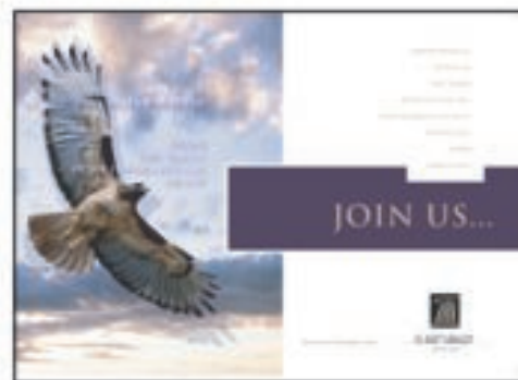
Annonceur Karthago Group