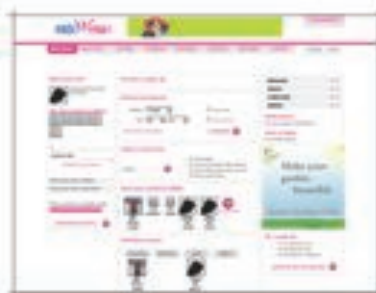
ENTIWENA.COM Site de rencontres tunisien