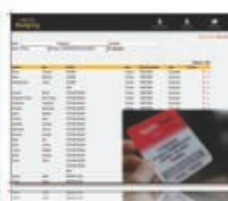
BADGING Solution de badging pour évènements professionnels