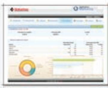
SOTUCHOC Application de gestion des actions Marketing