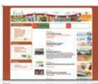
TENNIS CLUB DE TUNIS Site évènementiel