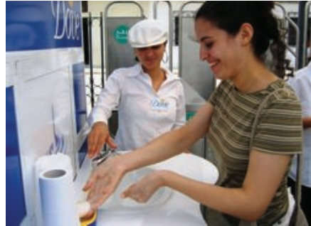
Démonstration Dove (Station Ariana)