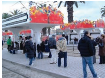
Personnalisation (Habillage Station)