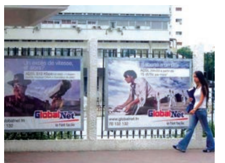
Un support de masse et de grande couverture