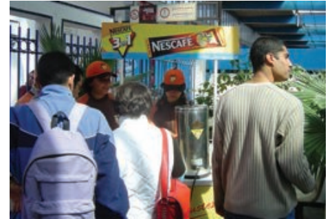
Dégustation Nescafé (Station Tunis Marine)