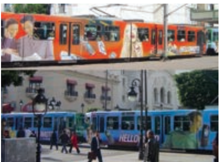
Les Rames de Métro