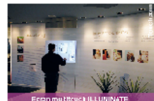
Écran mural touch ILLUMINATE