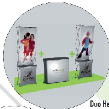
Duo Hello Xpression