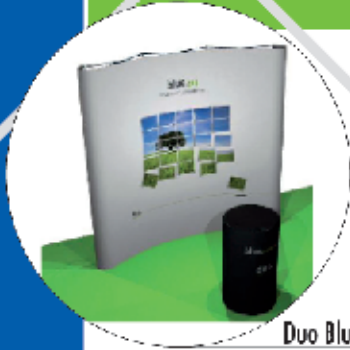
Duo Blue 3x3